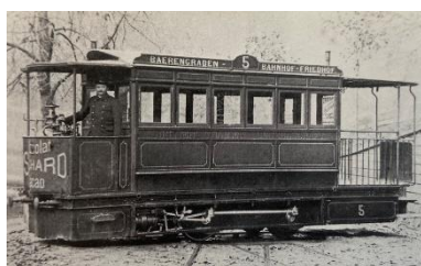
Die beiden Bilder stammen aus dem Berner Trambuch von Peter Tschanz, Fischer Media.

Das Alte Tramdepot blickt auf eine lange Geschichte zurück. Die Räumlichkeiten wurden 1889/90 als Depot für das Drucklufttram Bärengraben-Bremgartenfriedhof durch die Tramway-Gesellschaft Bern errichtet.